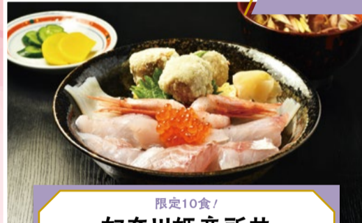
限定10食! 奴奈川姫産所井 1人前 2,640円