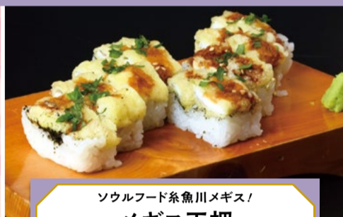
ソウルフード糸魚川メギス! メギス天押 1人前 660円