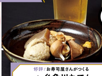
好評!お寿司屋さんがつくる 元祖 糸魚川おでん 1人前 990円 (税込) テイクアウト 要予約