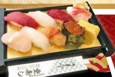
※各一人前のお値段です。