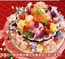
※場合により、写真と一部内容が異なる場合がございます。